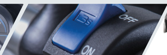
TECNOLOGÍA SMART DRIVE PARA AHORRO DE COMBUSTIBLE