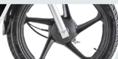
AROS DE ALEACIÓN Y DISEÑO RENOVADO

*Fotografía de referencia, los modelos pueden variar según el país