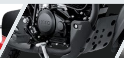
PROTECTOR DE MOTOR