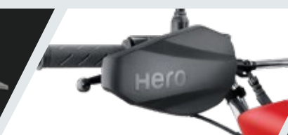
PROTECTOR DE NUDILLOS